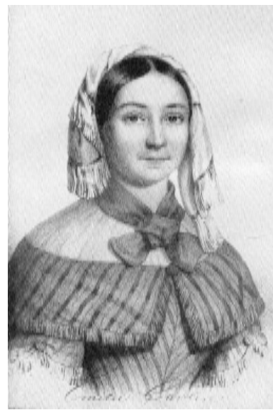
Emilie Flygare-Carlén vid 35 års ålder 1842.